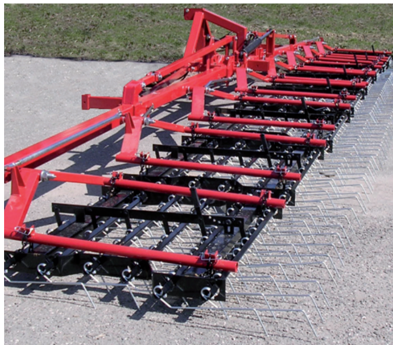
Frangizolle nuova serie Panther e strigliatore per lavorazione biologica SF

AZIENDA INTERNAZIONALE. FAZA è ovviamente anche presente sul mercato internazionale: l'azienda è infatti riuscita a costruire una vasta rete di distributori, che le permette di essere presente e apprezzatissima anche al di fuori dei confini nazionali, in Europa e in diversi paesi del mondo. Circa il 50% dei prodotti realizzati ogni anno infatti è destinato ad essere esportato, un dato non da sottovalutare perché evidenzia il successo del marchio e la sua capacità di rimanere competitivo anche con gli altri grandi marchi globali.