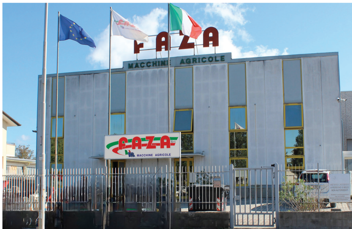
La sede di FAZA Srl, azienda che da oltre 30 anni rappresenta eccellenza nel campo della produzione delle macchine agricole

Nel 1990 ecco l'ufficio Export con personale qualificato